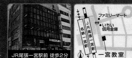
JR尾張一宮駅前 徒歩2分